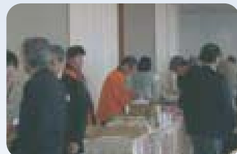
今年も、素晴らしい郷土の名産、名酒を賜りました。

※ドコモとauの携帯からアクセスできます。※見たいけどやり方が分からない、という方は 丹生谷(30回)tel:090-8508-8653まで、お問い合わせください。