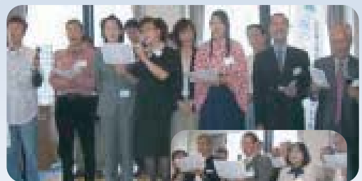
校友歌「味酒ヶ原」の斉唱では 新旧大いに入り混じり、 盛り上がりました。

ご列席いただきました皆さま、ならびに総会・同窓会の準備に奔走していただきました 事務局・幹事・後輩の方々、楽しい時間をありがとうございました。そして今回、残念な がら参加できなかった皆さま。年会費をお納めいただき、本当にありがとうございました。 来年度のご参加を、心よりお待ちしております。