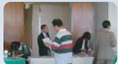
事務局のみなさまおつかれさまでした。